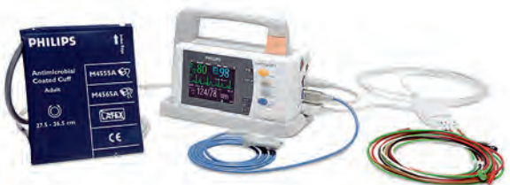
Компания Philips предлагает широкий ассортимент расходных материалов и принадлежностей, включая манжеты, датчики SpO 2 , различные кабели и электроды, позволяющие повысить эффективность работы используемого оборудования Philips.