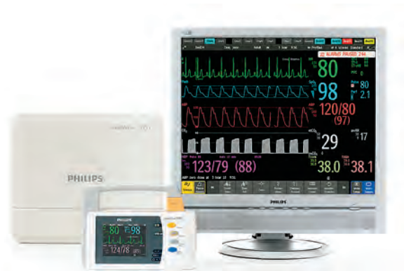
IntelliVue MP2 и вариант поставки с большим монитором и программным обеспечением IntelliVue XDS.