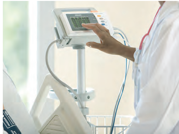
Сенсорный экран с хорошо понятными элементами управления и настраиваемыми программными кнопками.