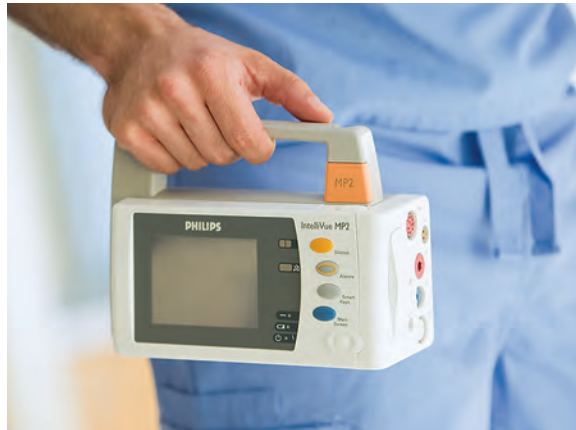
Масса монитора в базовой конфигурации – всего 1,5 кг.

IntelliVue MP2 с легкостью обеспечивает мониторинг в любом месте и в любое время.