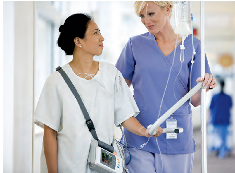
Монитор IntelliVue MP2 настолько компактен, что его легко могут переносить пациенты с нетяжелыми формами заболеваний.

Оригинальное решение для энергоэффективности IntelliVue MP2 – изделие компании Philips со статусом «Зеленый Флагман» (Green Flagship), при производстве и эксплуатации которого были учтены самые строгие требования к защите окружающей среды.