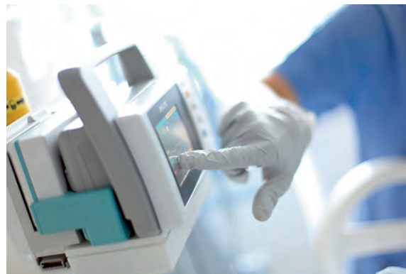
Дополнительный модуль Philips X2/MP2 Battery Extension позволяет увеличить время работы от аккумулятора вплоть до шести часов для внутрибольничной перевозки пациента с сопутствующим измерением CO 2 и дополнительным инвазивным измерением артериального давления и температуры.